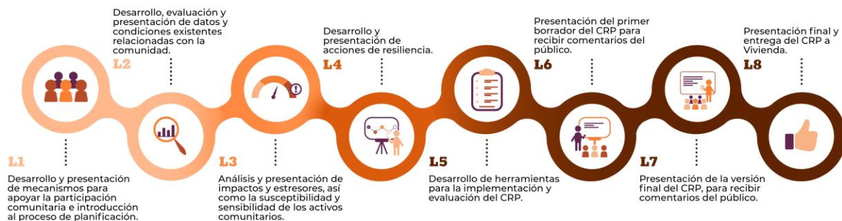
Figure 2: Imagen mostrando los ocho (8) Logros del proceso de planificación.